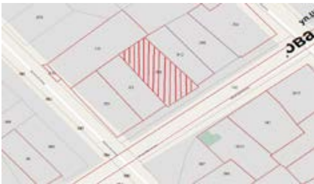
Схема расположения земельного участка

В случае поступления в течение тридцати дней со дня опубликования извещения заявлений (лично) от иных граждан о намерении участвовать в аукционе Администрация в недельный срок со дня поступления этих заявлений принимает решение об отказе в предварительном согласовании земельного участка без проведения аукциона лицу, обратившемуся с заявлением о предварительном согласовании предоставлении земельного участка.