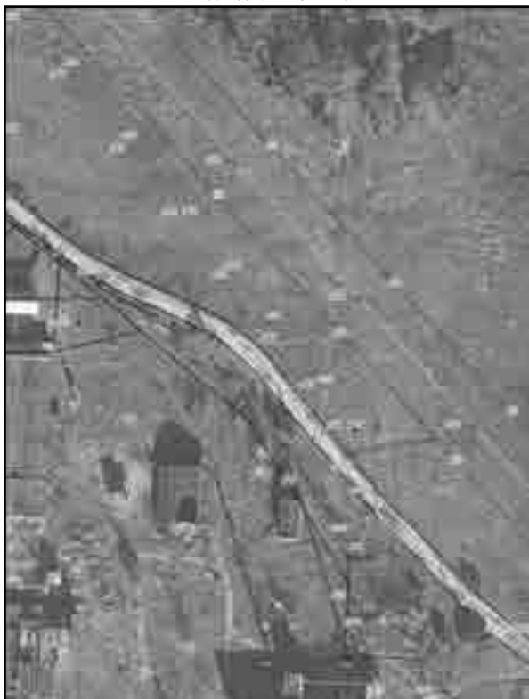
Масштаб 1:2000 Используемые условные знаки и обозначения: Условные обозначения представлены на листе 8