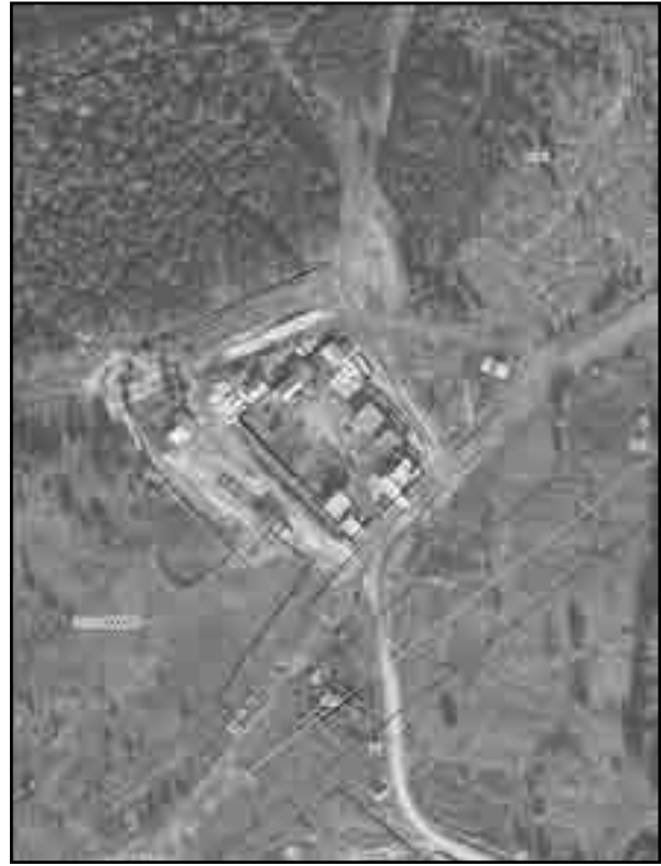
Раздел 4 Схема расположения границ публичного сервитута Выносной лист № 5

Используемые условные знаки и обозначения: Условные обозначения представлены на листе 8