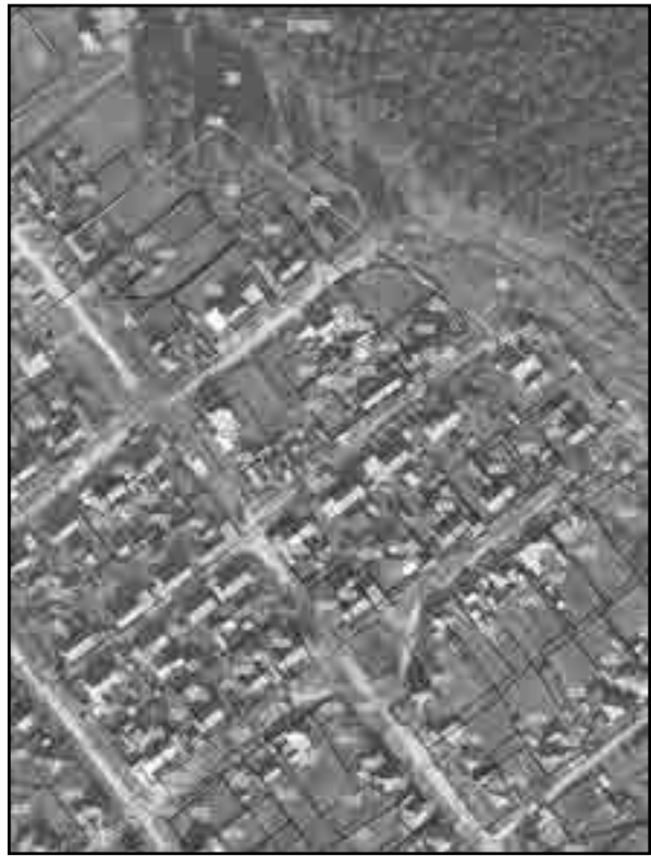
Масштаб 1:2000 Используемые условные знаки и обозначения: Условные обозначения представлены на листе 8