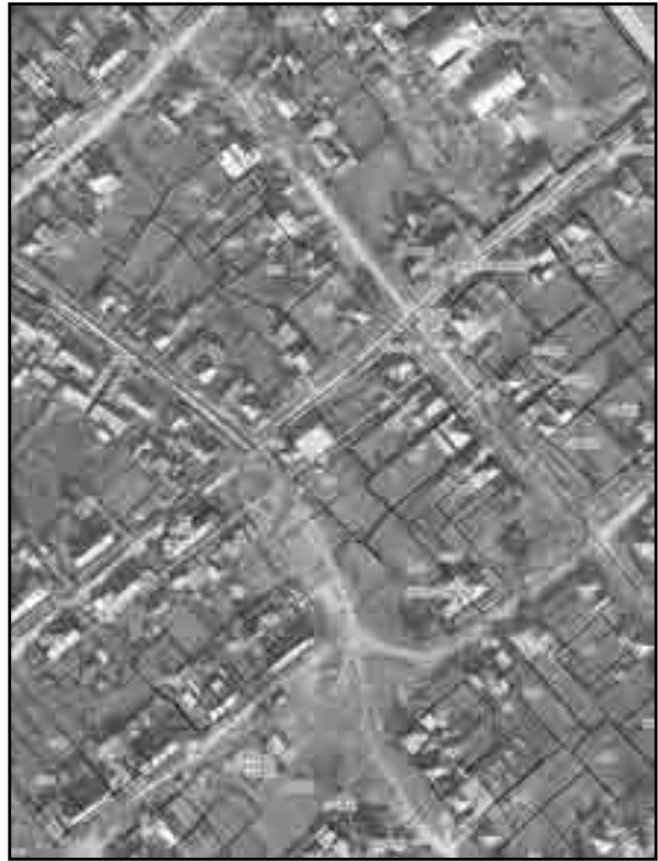
Масштаб 1:2000 Используемые условные знаки и обозначения: Условные обозначения представлены на листе 8