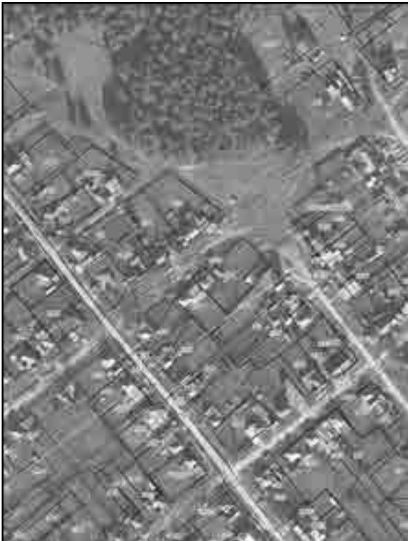
Масштаб 1:2000 Используемые условные знаки и обозначения: Условные обозначения представлены на листе 8