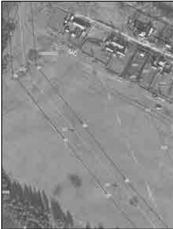
Раздел 4 Схема расположения границ публичного сервитута Выносной лист № 3