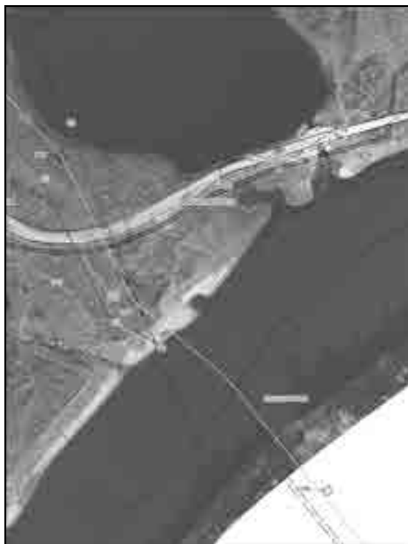
Масштаб 1:2000 Используемые условные знаки и обозначения: Условные обозначения представлены на листе 8