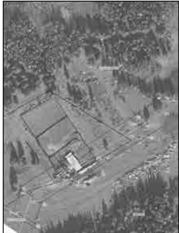
Масштаб 1:2000 Используемые условные знаки и обозначения: Условные обозначения представлены на листе 8