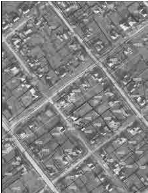
Масштаб 1:2000 Используемые условные знаки и обозначения: Условные обозначения представлены на листе 8