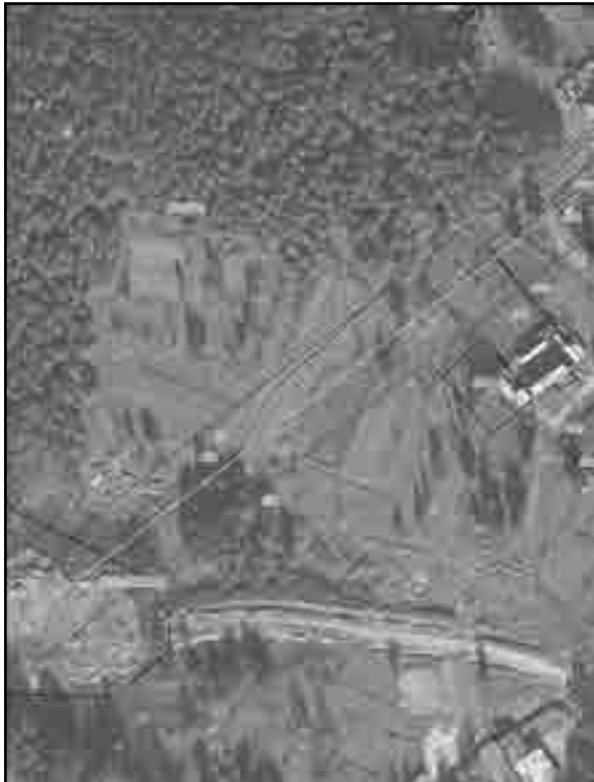
Масштаб 1:2000 Используемые условные знаки и обозначения: Условные обозначения представлены на листе 8