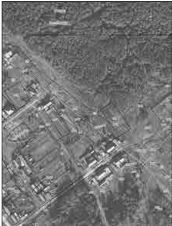
Масштаб 1:2000 Используемые условные знаки и обозначения: Условные обозначения представлены на листе 8