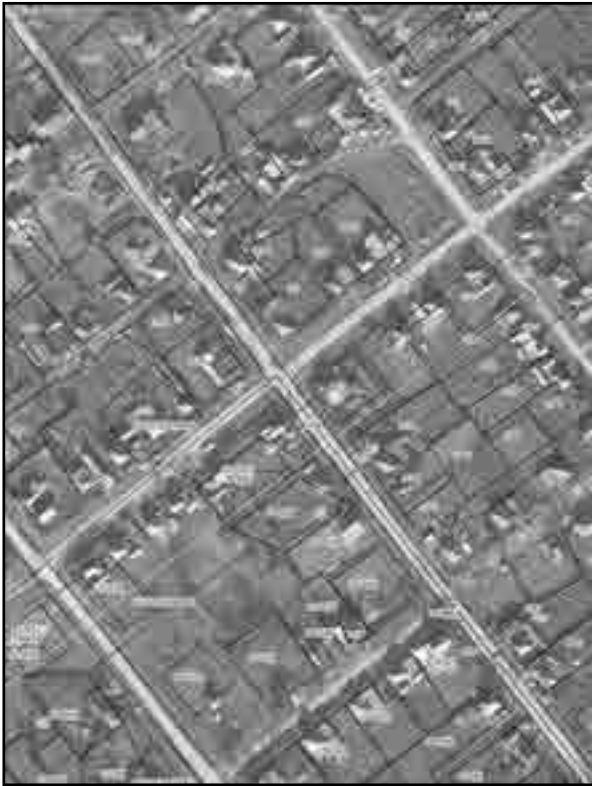
Масштаб 1:2000 Используемые условные знаки и обозначения: Условные обозначения представлены на листе 8