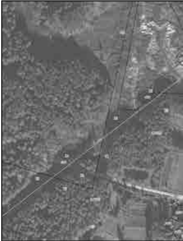
Масштаб 1:2000 Используемые условные знаки и обозначения: Условные обозначения представлены на листе 8