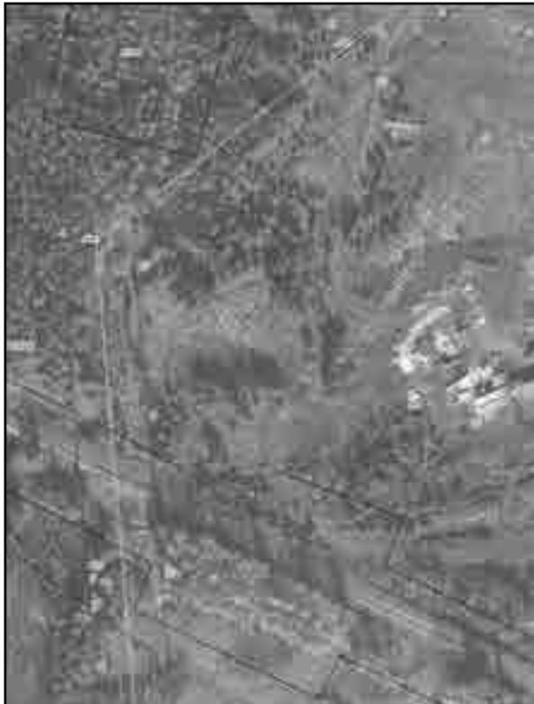
Раздел 4 Схема расположения границ публичного сервитута Выносной лист № 4

Используемые условные знаки и обозначения: Условные обозначения представлены на листе 8