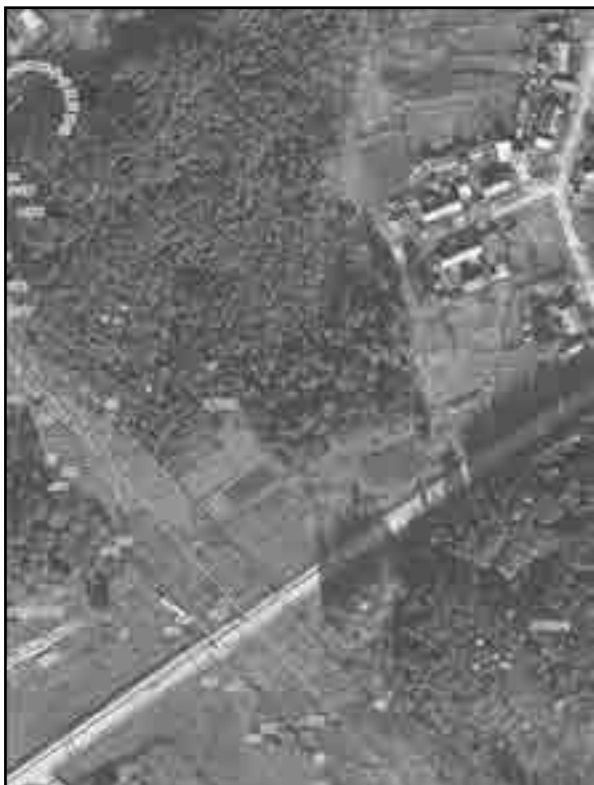
Масштаб 1:2000 Используемые условные знаки и обозначения: Условные обозначения представлены на листе 8