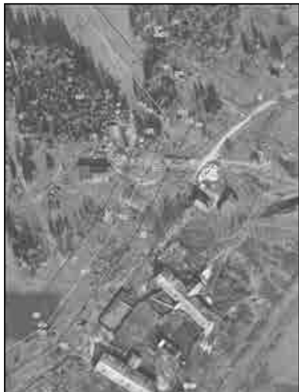
Масштаб 1:2000 Используемые условные знаки и обозначения: Условные обозначения представлены на листе 8