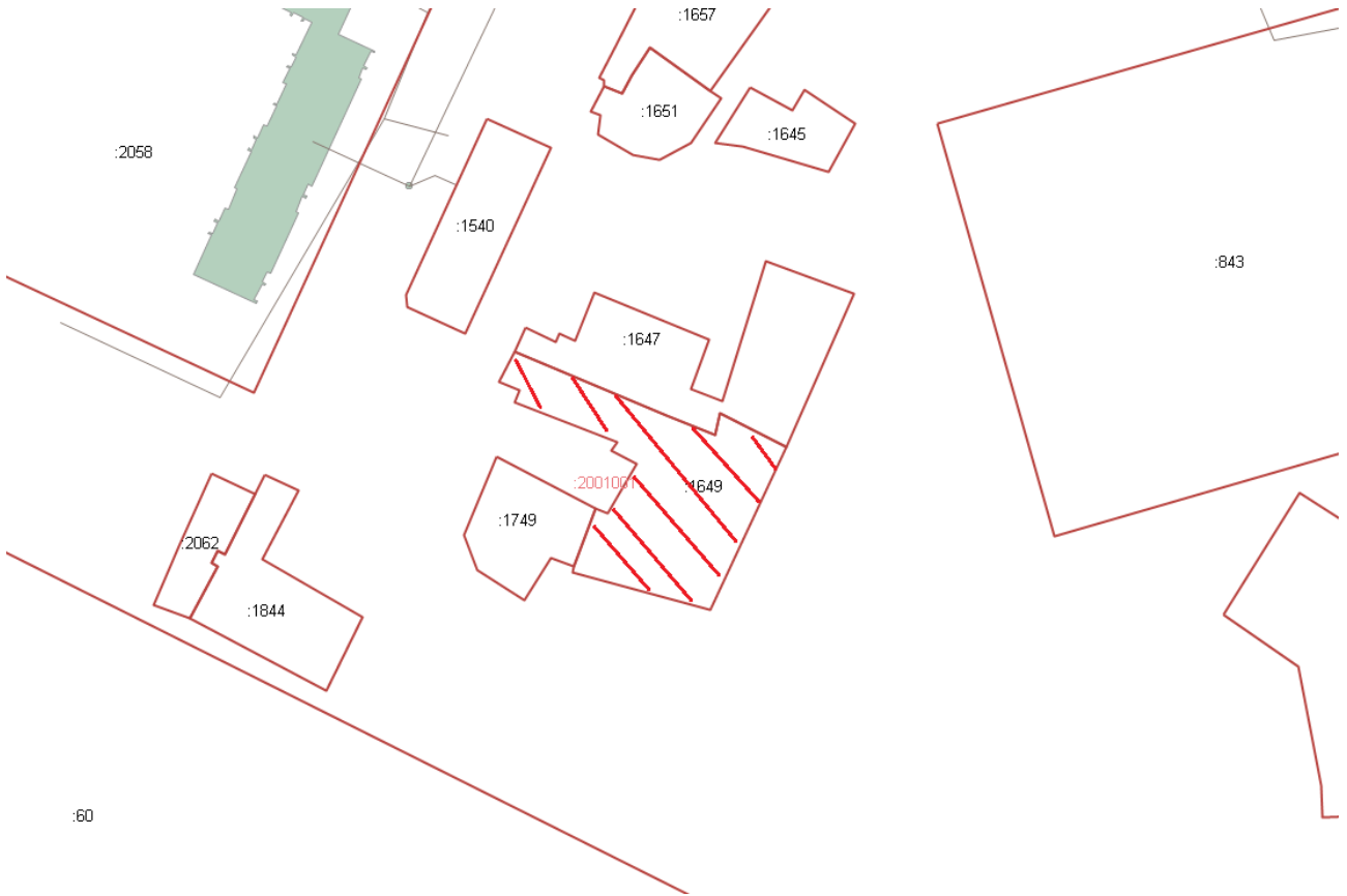
Схема расположения земельного участка

В случае поступления в течение тридцати дней со дня опубликования извещения заявлений (лично) от иных граждан о намерении участвовать в аукционе Администрация в недельный срок со дня поступления этих заявлений принимает решение об отказе в предоставлении земельного участка без проведения аукциона лицу, обратившемуся с заявлением о предоставлении земельного участка.